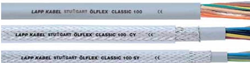
Rys. 2. Przewody zasilające. Od góry: Olflex Classic 100, ekranowany Olflex Classic 100 CY oraz wzmacniany Olflex Classic 100 SY

Autor jest pracownikiem firmy Lapp Kabel